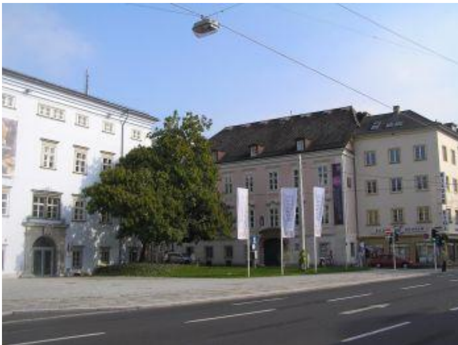
A „studium generale” (Katholisch-Theologische Privatuniversität) rózsaszínben, bal oldalt pedig a Nordico múzeum.