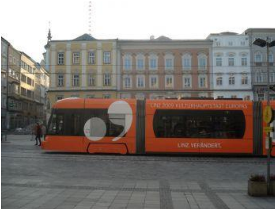
A főtér és a kulturális főváros logóját „viselő” villamos