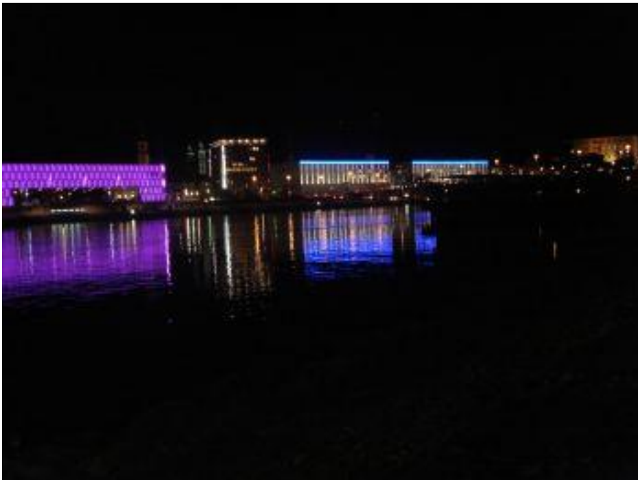
Linz by night