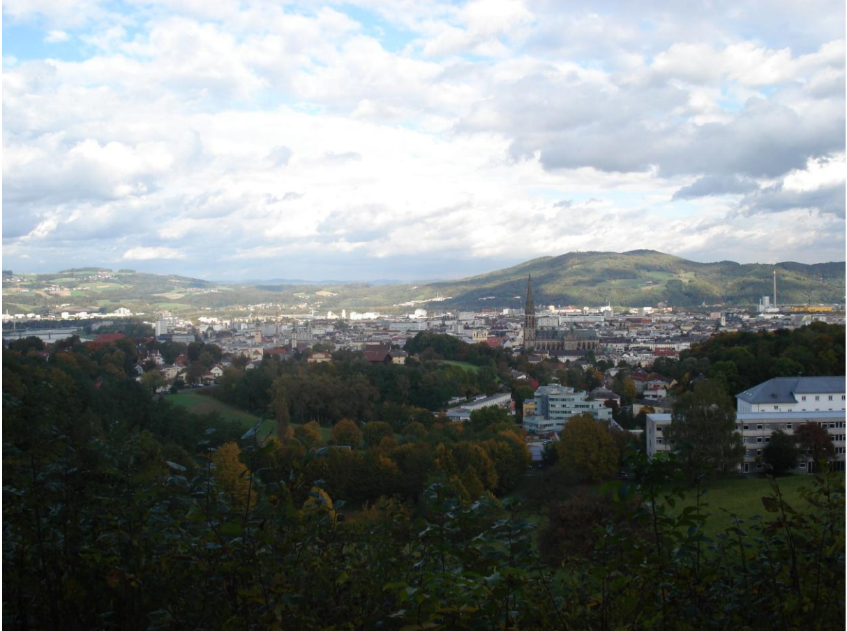
Linz látképe a város fölötti egyik dombról: a nagy katedrális a Neues Dom